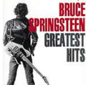
Bruce Springsteen ocupa 7º lugar com coletânea

banda de James Hetfield também ocupa a 8ª posição com a trilha sonora do filme "Through the Never", que acaba de chegar às lojas. A lista de músicas mais baixadas de ontem no iTunes Brasil ainda incluía "Nothing But the Beat" (2011), de David Guetta, na 5ª posição, e "Greatest Hits" (2010), do Bon Jovi, no 12º lugar.