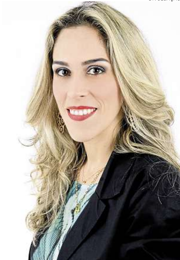
Autora disponibilizou primeiro capítulo na internet

"Hoje as pessoas fazem isso para aguçar a curiosi-